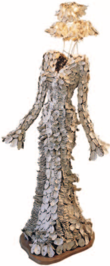
Patula Berm, Zephora , zilte druppels dwalend in oesters..., 2001; glas, oesterschelpen, staal, hout, hoed met schemerlamp; 205 x 125 x 130 cm