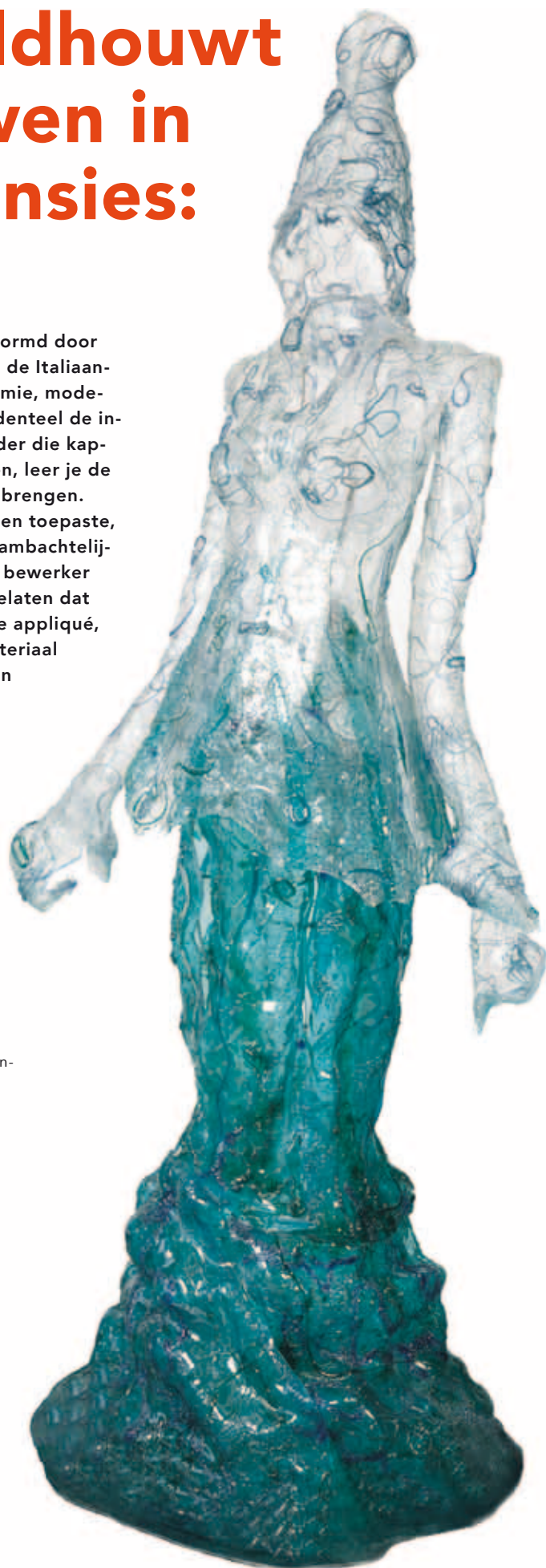
Patula Berm, Medusa , bekoorlijke vlechten als slangen met glanzende kwallen verstrengeld..., 1999; geblazen glas, kunsthaar, staal, hout; 190 x 100 x 75 cm