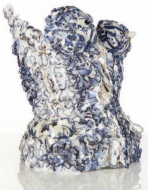
Patula Berm, Wild River , 2013; lampwork morettiglas, porselein, staal; 45 x 30 x 23 cm

Ze maakt, als zij aan een beeld werkt, om te beginnen een driedimensionale stalen constructie. Beheersing van de lastechniek is noodzaak, het maakt de materialisatie van de inwendige structuur mogelijk, met lassen begint haar beeld. Zij zoekt de ruimtelijke accenten die de verschijning van het beeld zullen bepalen in de vorm van buik, borsten, billen, heupen. Met hoed en lange mouwen, zonder kop en zonder armen.